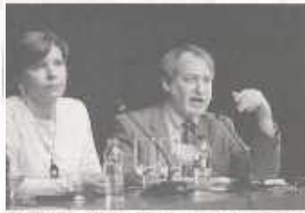
Las ponentes en el ciclo de conferencias sobre bibliotecas interculturales.

El ciclo de conferencias se celebrará los días 29 de enero y 5 de febrero a las 10.00 horas en el Salón de Actos de la Biblioteca de la Universidad de Granada. El ciclo de conferencias se celebrará los días 29 de enero y 5 de febrero a las 10.00 horas en el Salón de Actos de la Biblioteca de la Universidad de Granada.