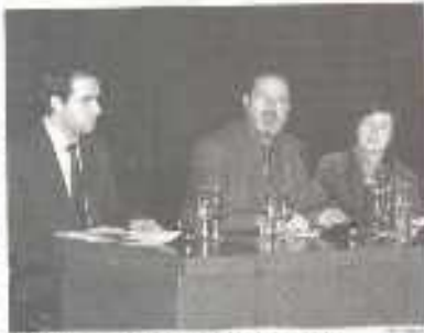
Los ponentes en el ciclo de conferencias sobre bibliotecas interculturales.

Los ponentes presentarán los servicios para inmigrantes en Alemania, EE.UU. y Australia